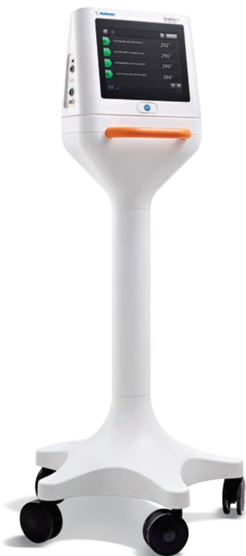
Symlicity G3™ RF-Generator zur renalen Denervierung