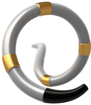
Symlicity Spyral™ Multielektrodenkatheter zur renalen Denervierung