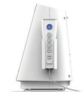
Fernbedienung für Symlicity G3™ Radiofrequenzgenerator